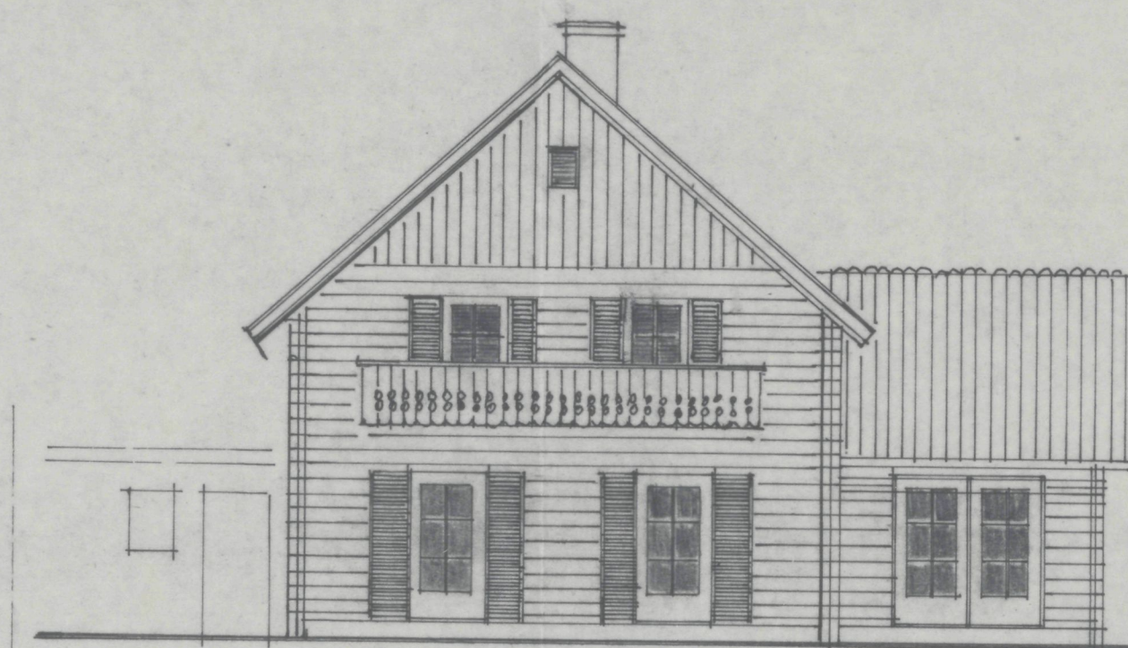
VOORAANZICHT BESTAANDE TOESTAND.