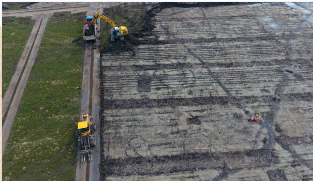
Impressie van de werkzaamheden: afgraven bovengrond en inmeten sporen.

Er waren zes graafdagen voor het publiek en men kon in het ochtend- of middagprogramma meedraaien. Ook waren er mensen die zich voor de hele dag en zelfs meerdere dagen hadden opgegeven. Voordat we aan de slag gingen gaf een archeoloog eerst een korte uitleg over de Westfriese bronstijd en de situatie in Waterweide. We hadden hiervoor posters gemaakt met daarop afbeeldingen van grondsporen, boerderijen en vondsten. Vervolgens kon iedereen een schep en troffel uitzoeken en werd de groep opgedeeld in kleine groepjes. Toen kon men onder begeleiding van de archeologen aan de slag. We gingen natuurlijk niet zomaar willekeurig ergens graven, we hadden enkele onder-