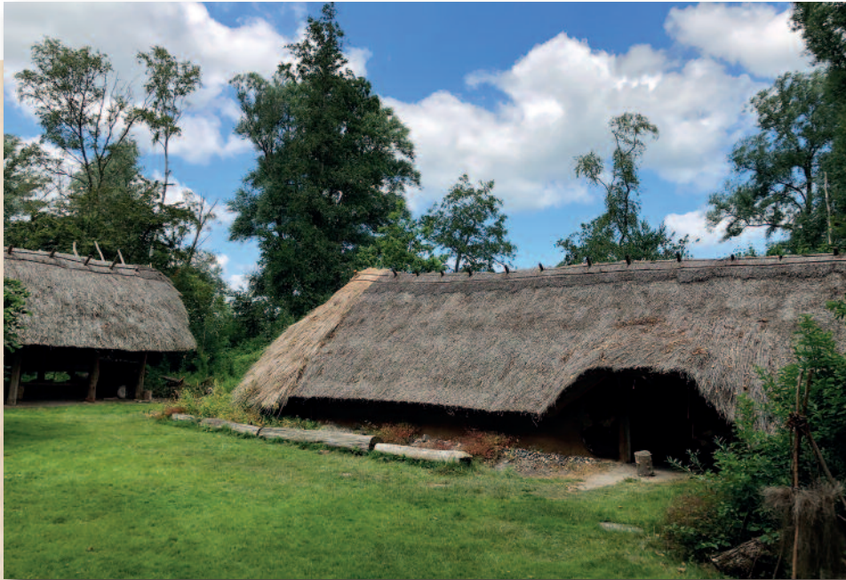
De bronsjildboerderij in het Zuiderzeemuseum te Enkhuizen.

In een van de bronsjildsloten werden grote scherven gevonden, waarvan de meeste nog aan elkaar konden worden geplakt. Zo krijgen we een goed beeld hoe de pot eruit heeft gezien.