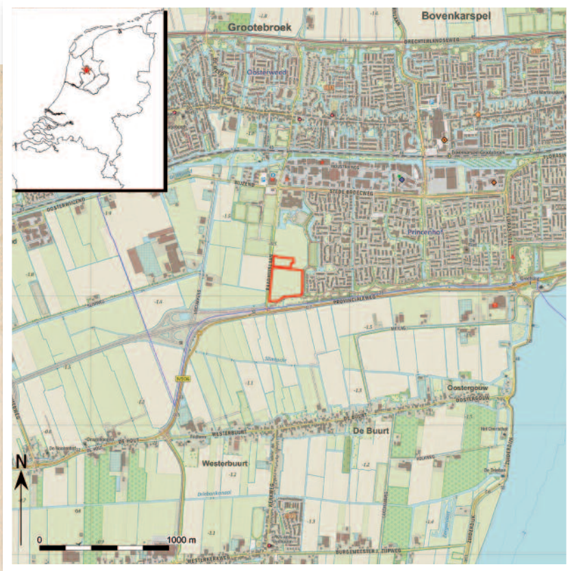
Lokatie van de opgraving Waterweide.