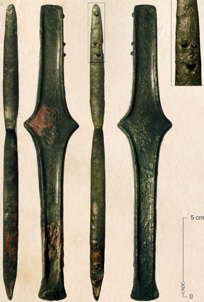
Een geknikte randbeitel van brons gevonden aan de Binnenwijzend-Westwoud.

zet en archeologen doen hier al ruim 75 jaar onderzoek naar. Dit begon met het onderzoek van grafheuvels in de jaren '40 van de vorige eeuw. Deze heuvels waren toen nog goed zichtbaar in het land, ze hadden een omtrek van soms wel 20 meter en waren soms nog een meter hoog. In deze grafmonumenten werden goed bewaarde skeletten van de overledenen gevonden. Soms werden er mooie spullen aan de doden meegegeven. Beroemd is een fraai bronzen zwaard uit Zwaagdijk en in 2015 werd aan de Binnenwijzend een gave bronzen beitel gevonden. Het onderzoek naar de grafheuvels leverde veel informatie op over het grafbestel, maar de archeologen hadden nog geen idee waar en hoe de Westfriese bronsijdboeren woonden. Dat veranderde toen ze in de jaren '60 van de vorige eeuw langs de Streekweg in Hoogkarspel gingen graven. Voor het eerst werden de grondsporen van boerderijen opgetekend en daaromheen enorm veel slootjes. Uit de opgravingen bleek dat grote delen van oostelijk West-Friesland in de bronsijdtijd in cultuur waren gebracht, de grootschaligheid van dat ingerichte landschap was echter lastig in kaart te brengen omdat meestal maar een klein terrein kon worden onderzocht. Halverwege de jaren '70 werd daarom een heel groot gebied door