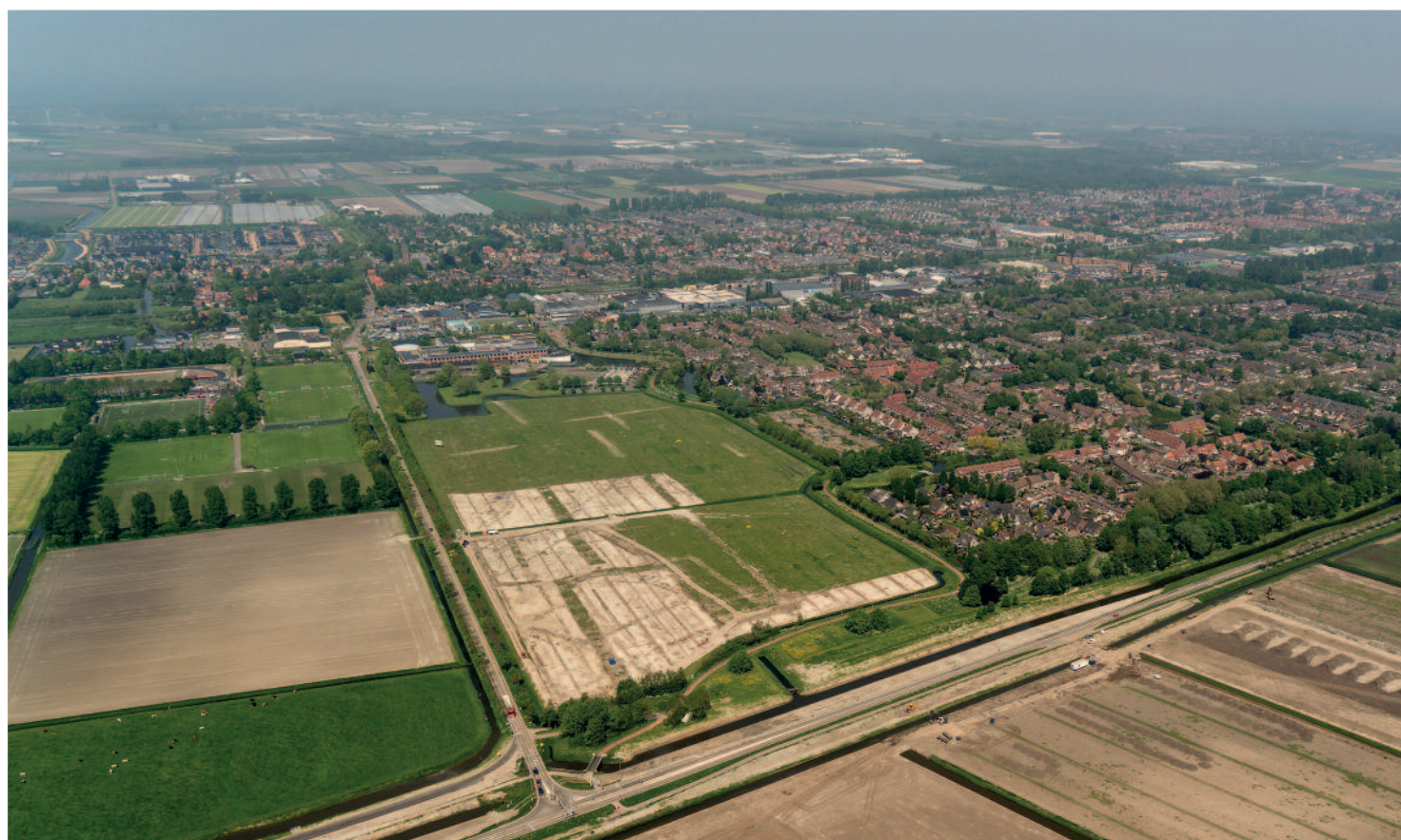
De rechthoekige werkputten van de opgraving Waterweide vanuit de lucht, voorjaar 2018.

Oostelijk West-Friesland was in de bronstijd, zo'n 3.500 jaar geleden, een zeer aantrekkelijk woongebied. De Westfriese bronstijdboeren hebben het land vele eeuwen op grote schaal ingericht en dat kan door archeologische opgravingen fraai in beeld worden gebracht. In het voorjaar van 2018 ontstond een bijzondere kans om dit ingerichte bronstijdlandschap te onderzoeken. Voorafgaand aan de ontwikkeling van de nieuwbouwwijk Waterweide in Grootebroek, gemeente Stede Broec, werd van een groot terrein de bovengrond afgegraven en afgevoerd. Dit was voor de archeologen een unieke mogelijkheid om een omvangrijk deel van het cultuurlandschap uit de bronstijd in kaart te brengen.