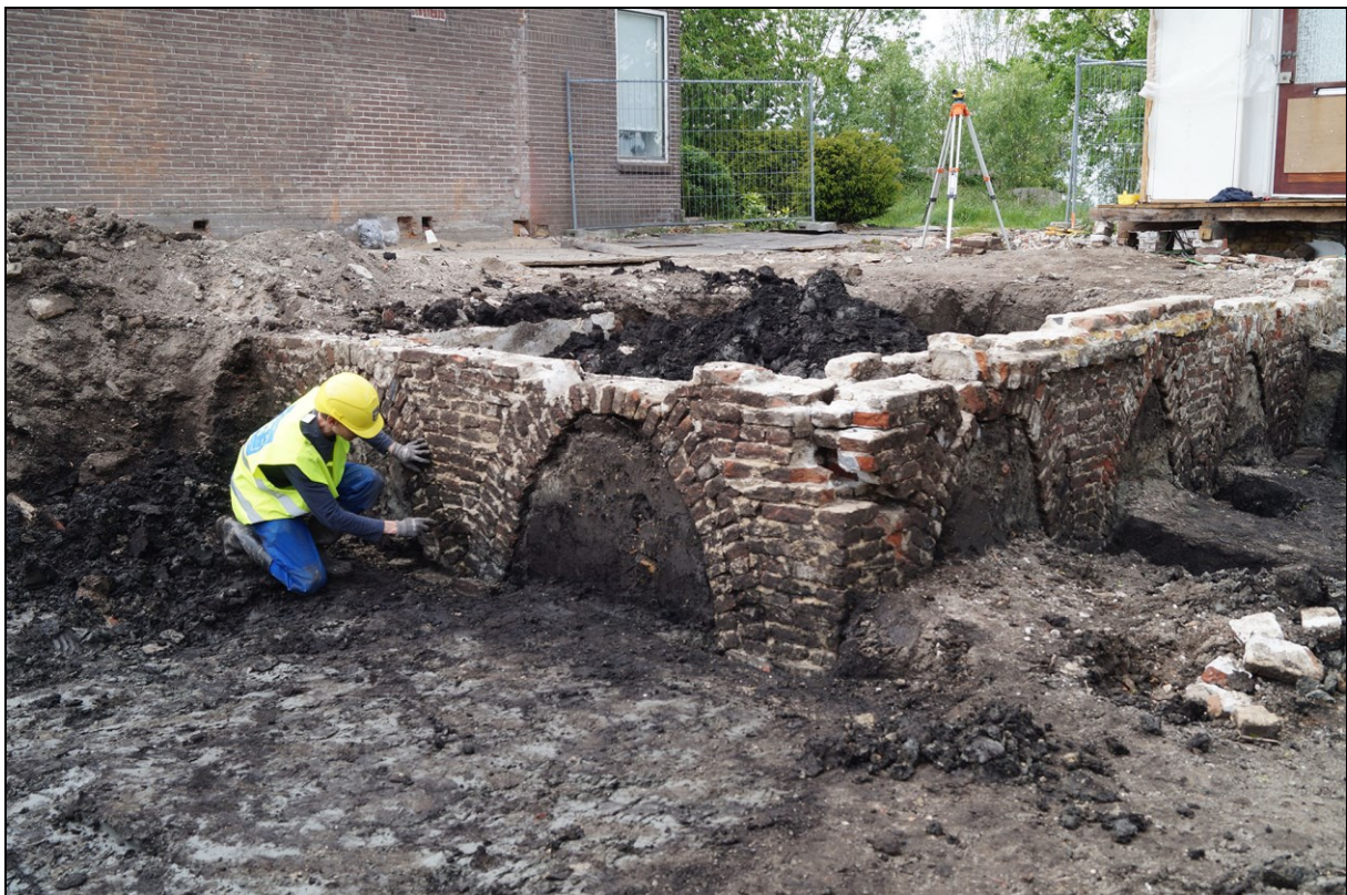
Afbeelding 4. Opgraving Westeinde 322 Berkhout, juni 2015.

De provincie Noord-Holland heeft 10 archeologische gebieden van provinciaal belang gedefinieerd. De gemeente Koggenland ligt in een dergelijk gebied: West-Friesland. Als in gebieden van provinciaal belang het maatschappelijk belang dusdanig groot is dat waardevolle archeologische vindplaatsen aangetast moeten worden, vraagt de provincie aan te geven op welke wijze archeologische waarden door compenserende maatregelen in het plan zijn ondergebracht.