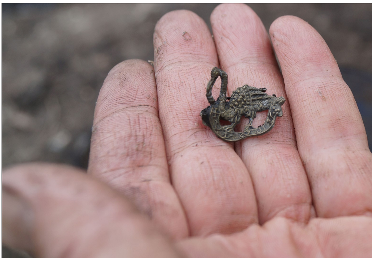
Afbeelding 6. Een insigne gevonden tijdens de opgraving Drechterlandsedijk 6-10, mei 2014.

Bij ruimtelijke ontwikkelingen kan deze kaart vrij eenvoudig inzicht geven over de noodzaak van archeologisch onderzoek. Archeologie West-Friesland zal in eerste instantie een quickscan uitvoeren, waarbij de onderliggende kaartlagen en beweegreden voor de op de advieskaart aangegeven gebieden worden geconfronteerd met de te verwachten bodemverstorende werkzaamheden. Door een quickscan in te bouwen wordt onnodig archeologisch onderzoek voorkomen.