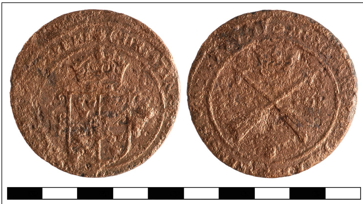
Afbeelding 13. Twee keerzijden van een Zweedse munt uit 1638, gevonden bij de opgraving Scharwoude 7, juli 2015.

Nijdam, R., 2010. Hensbroek, Dorpsweg 18 (gemeente Koggenland). Een Bureauonderzoek en Inventariserend Veldonderzoek in de vorm van een verkennend booronderzoek. ADC-rapport 2189. ADC-ArcheoProjecten, Amersfoort.