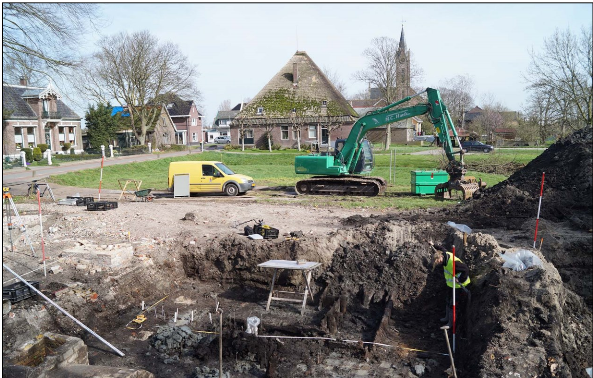
Afbeelding 8. Opgraving Kerkerbuurt 190 Berkhout, maart 2014.