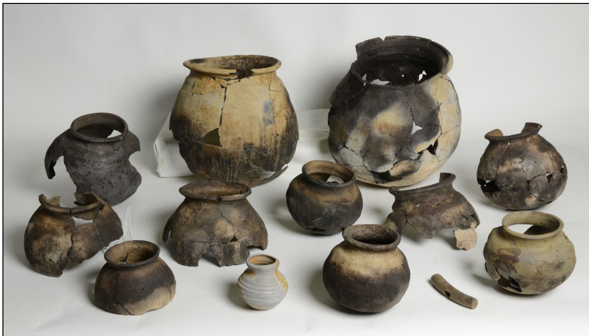
Afbeelding 3. Verzameling kogelpotten, gevonden tijdens de opgraving aan het Westeinde 322 in Berkhout.

In het 'Beleidskader Landschap en Cultuurhistorie Noord-Holland' (Provincie Noord-Holland, 2006) is het archeologisch beleid van de provincie Noord-Holland omschreven: