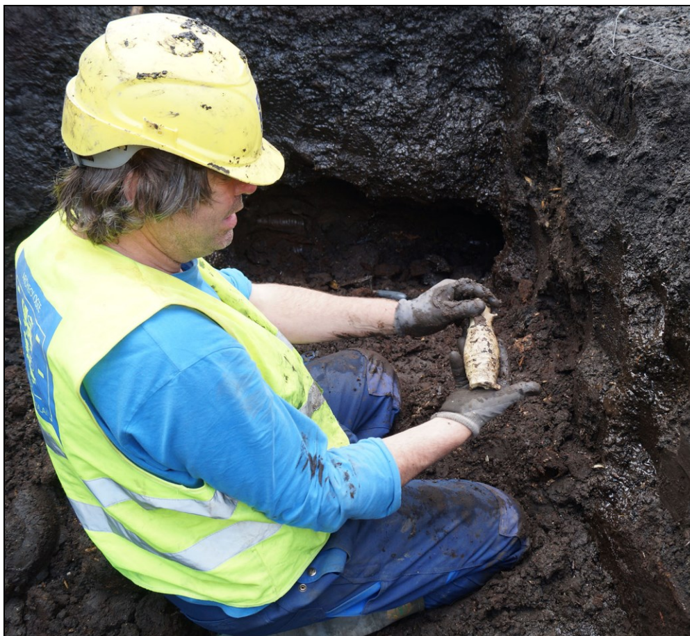
Afbeelding 10. Opgraving Drechterlandsedijk 6-10, mei 2014.