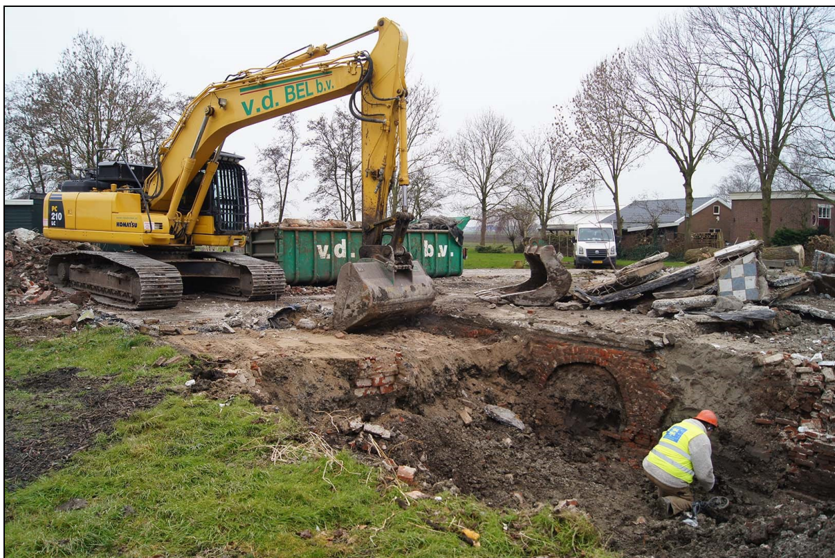
Afbeelding 9. Opgraving Westeinde 312 Berkhout, maart 2016.