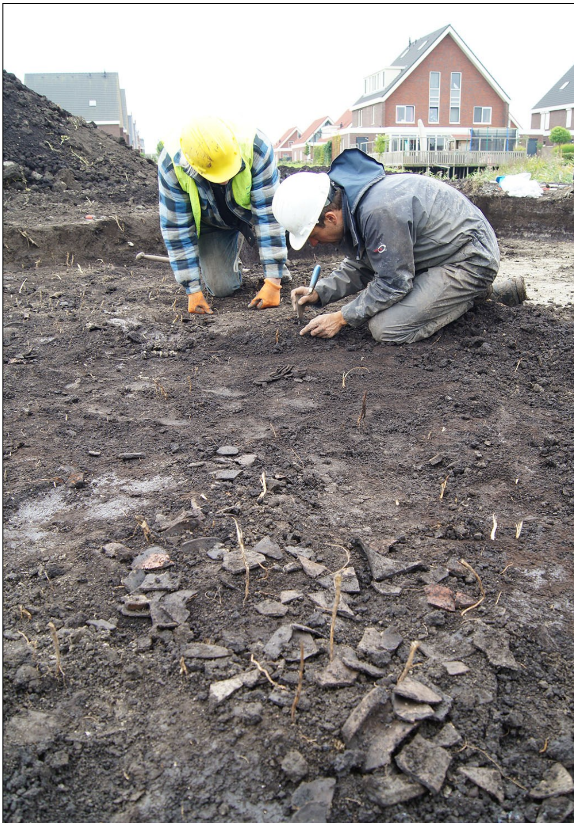
Afbeelding 2. Opgraving De Tuinen Ursem, september 2012.