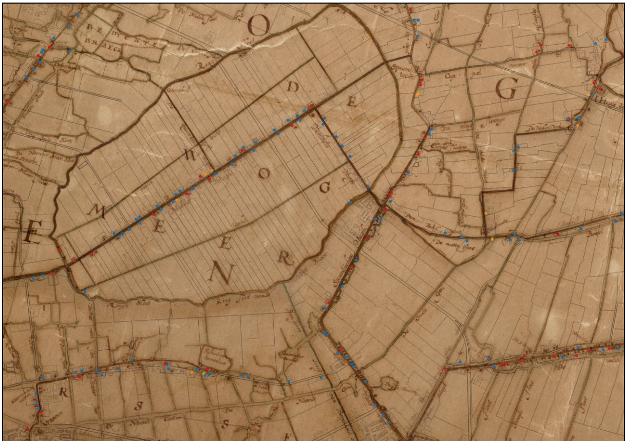
Afbeelding 7. Inventarisatie van oude stolpboerderijen in de gemeente Koggenland.

Het verdient de aanbeveling om bij ontwikkelingen in een archeologisch waardevol (verwachtings)gebied van te voren een quickscan te laten uitvoeren door Archeologie West-Friesland. De ruimtelijke ontwikkelingen worden dan afgezet tegen de aanwezige of te verwachten archeologische waarden. De op de archeologische advieskaart aangegeven vlakken zijn gebaseerd op bureauonderzoek en kaartanalyse, die niet tot uitdrukking komen op de archeologische beleidskaart. Op deze wijze wordt onnodig onderzoek voorkomen.