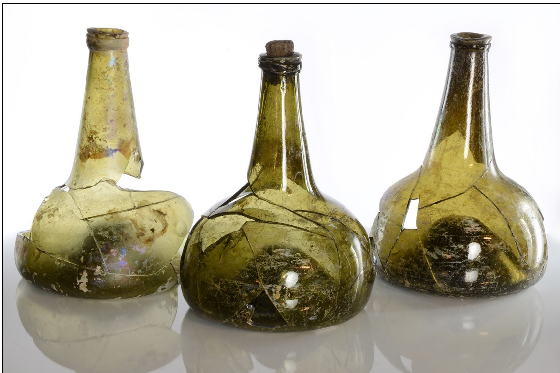
Afbeelding 11. Drie glazen flessen gevonden bij de opgraving Scharwoude 7, juli 2015.

Alders, G.P., 2006e. Bureauonderzoek naar de archeologische waarde van Dorpsstraat 32, gemeente Obdam. SCENH-rapport cultuurhistorie 68. Stichting Steunpunt Cultureel Erfgoed Noord-Holland, Wormer.