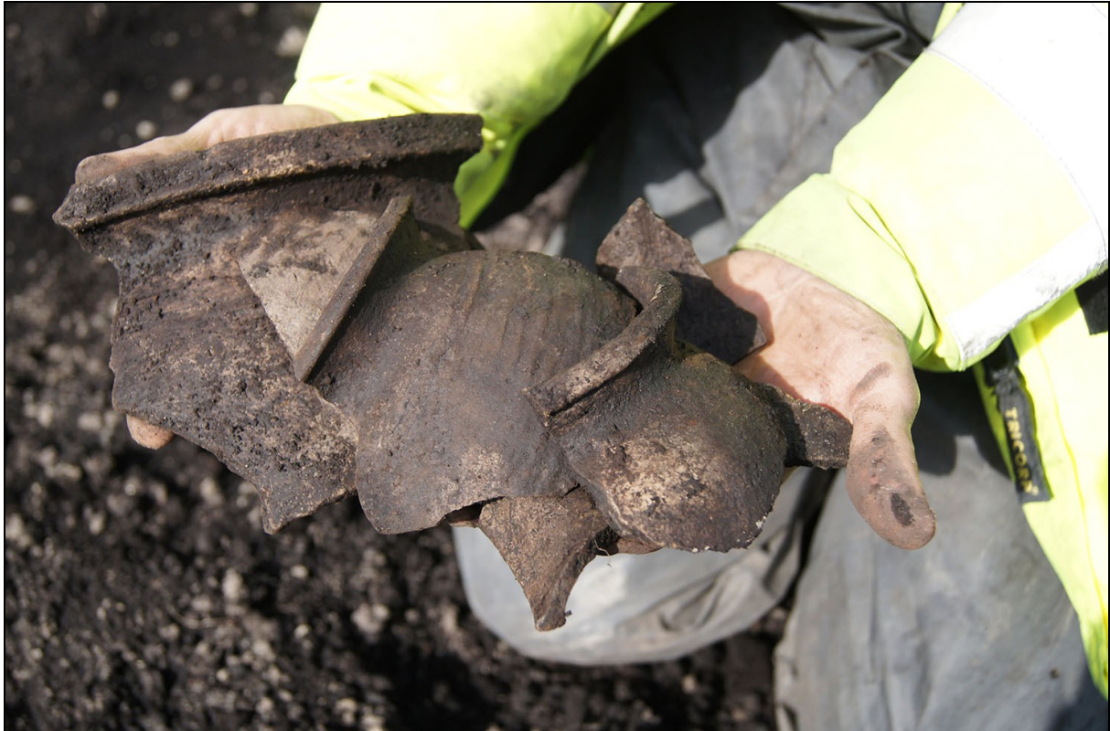
Afbeelding 12. Scherven van middeleeuwse kogelpotten, gevonden bij de opgraving De Tuinen in Ursem, september 2012.

Dijk, K. van & J.W. Oudhof, 2009. Bureauonderzoek en IVO Kabeltracé Oterleek- Westwoud, gemeente Schermer en Koggenland. Buro de Brug rapporten B09-30. Buro de Brug, Amsterdam